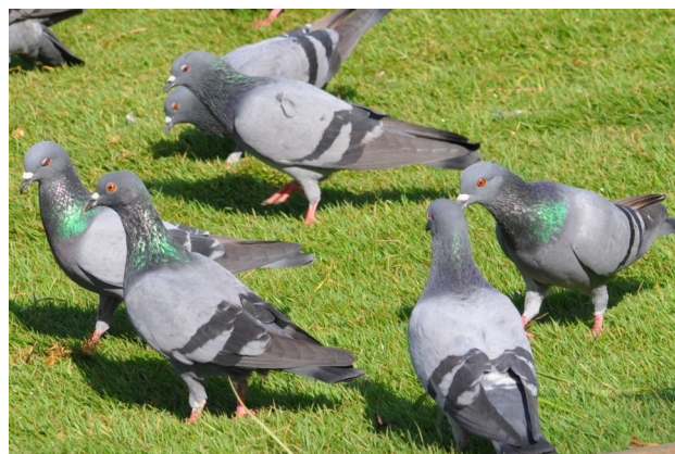
Mâles ou femelles

Mâles, femelles et juvéniles sont similaires . Les mâles sont plus massifs que les femelles , et vous les apercevrez peut-être en train de gonfler leur cou pour parader.